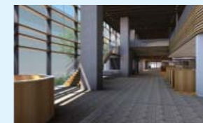
託児室などを備えた明るいロビー(イメージ)