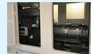
屋上に設置した非常用発電機