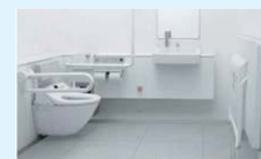
多目的トイレ(イメージ)