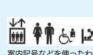
案内記号などを使ったわかりやすいサイン