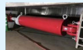
地震の揺れを吸収する免震オイルダンパー