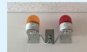
聴覚障がい者に災害などを伝える表示灯をトイレなどに設置