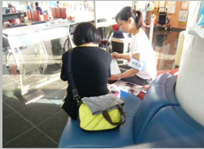
益城町総合運動公園でのヒアリング

実際避難所となった施設を現地調査し、避難生活者へのアンケートや管理者へヒアリングを実施。避難所のお困り事や現状をご報告します。