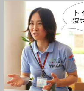
益城町総合運動公園管理者