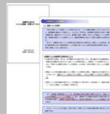
避難所におけるトイレの確保・管理ガイドライン (内閣府 平成28年4月)